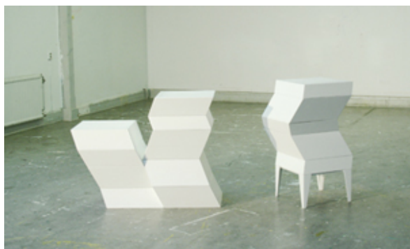
Oblique storage system från FULO.