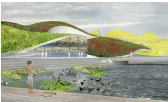
Kjellgren Kaminsky, Supersustainable City.