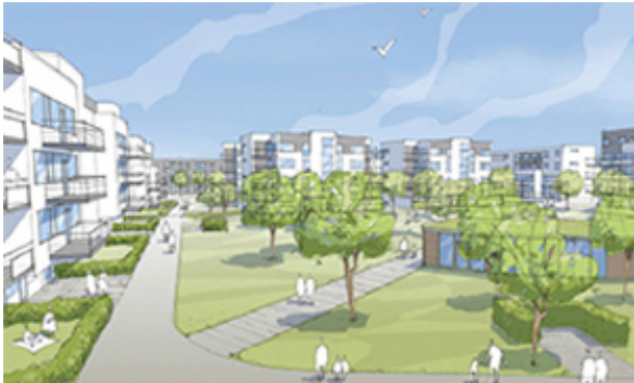
Illustration: Arkitektbyrån AB.

Konstepideminns dag den 29 maj. www.konstepidemin.se