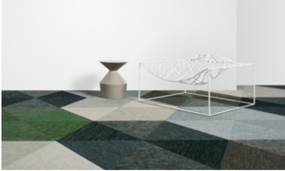
Golvet Botanic från Bolon.