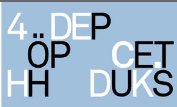
Illustration: Pascal Prosek