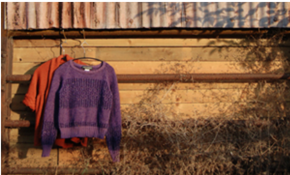
Eftersnack om återbruk. Foto:Lily Urbanska.