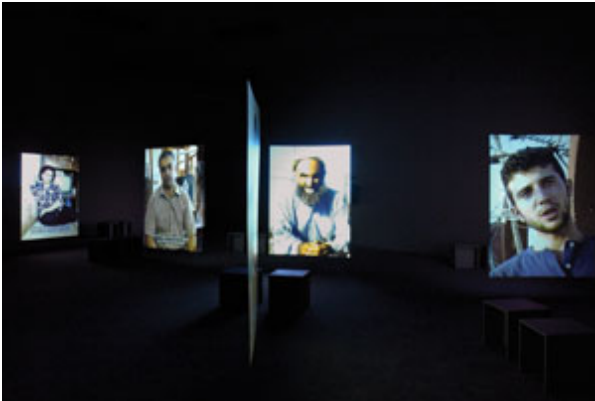
Twelve av Kutlu Ataman.