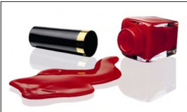
Åsa Jungnelius: Make it all up .