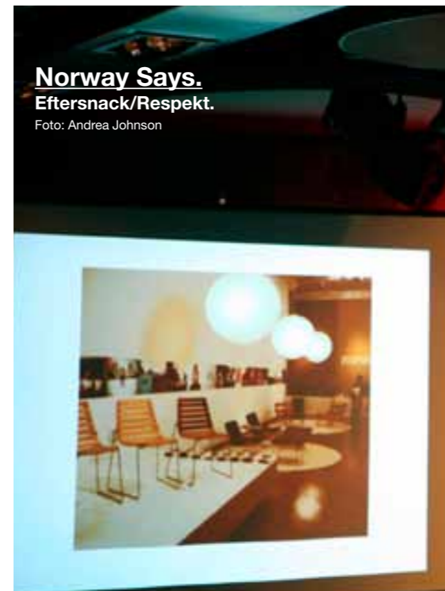
Norway Says. Eftersnack/Respekt.

Nätverket för Upplevelseindustrin. Ett nätverk med syfte att skapa tillväxt inom upplevelseindustrins branscher. Startade under hösten 2006. ADA deltog som en av åtta mötesplatser.