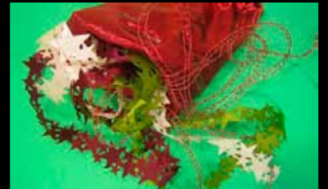
FUNK Gbg. Workshop.