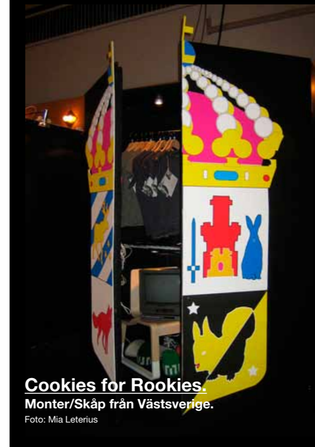
Cookies for Rookies. Monter/Skåp från Västsverige.