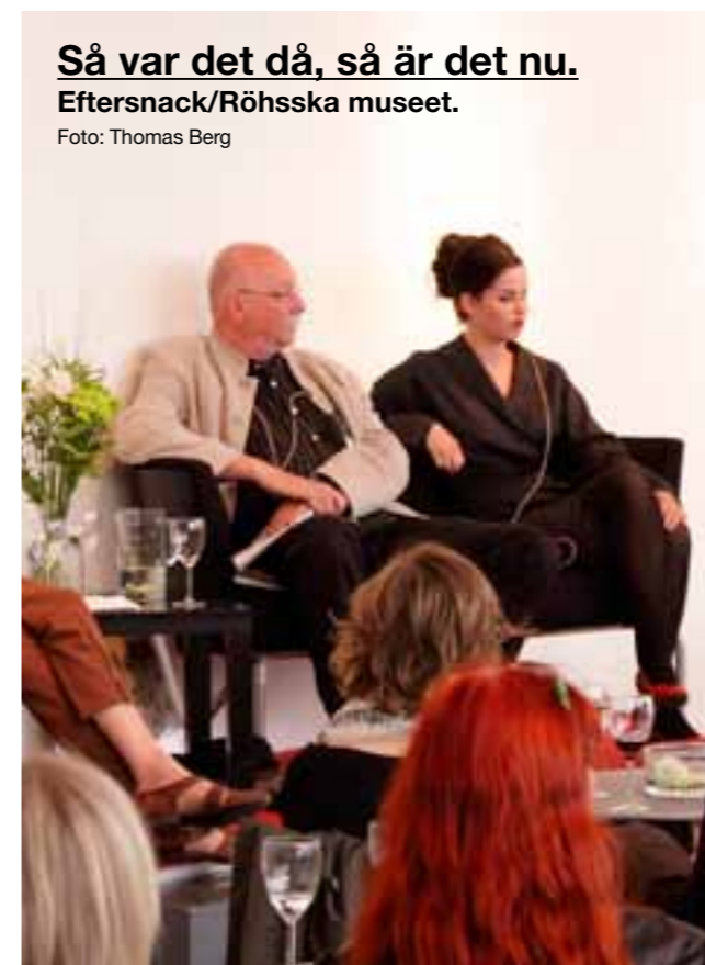
Så var det då, så är det nu. Eftersnack/Röhsska museet.