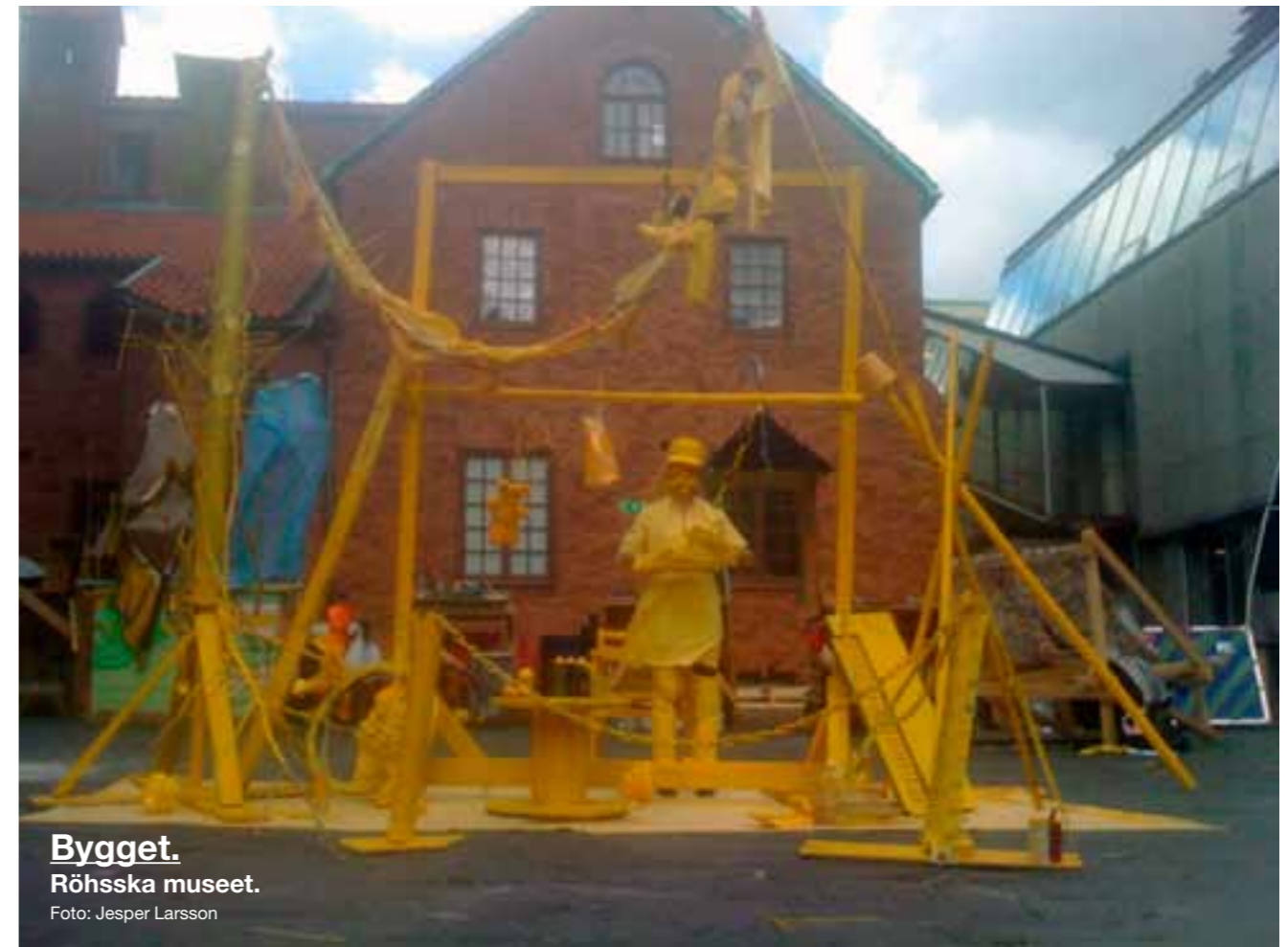
Bygget. Röhsska museet.