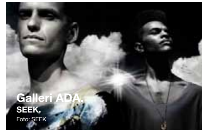
Galleri ADA. SEEK. Foto: SEEK