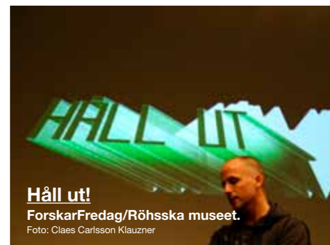
Håll ut! ForskarFredag/Röhsska museet.