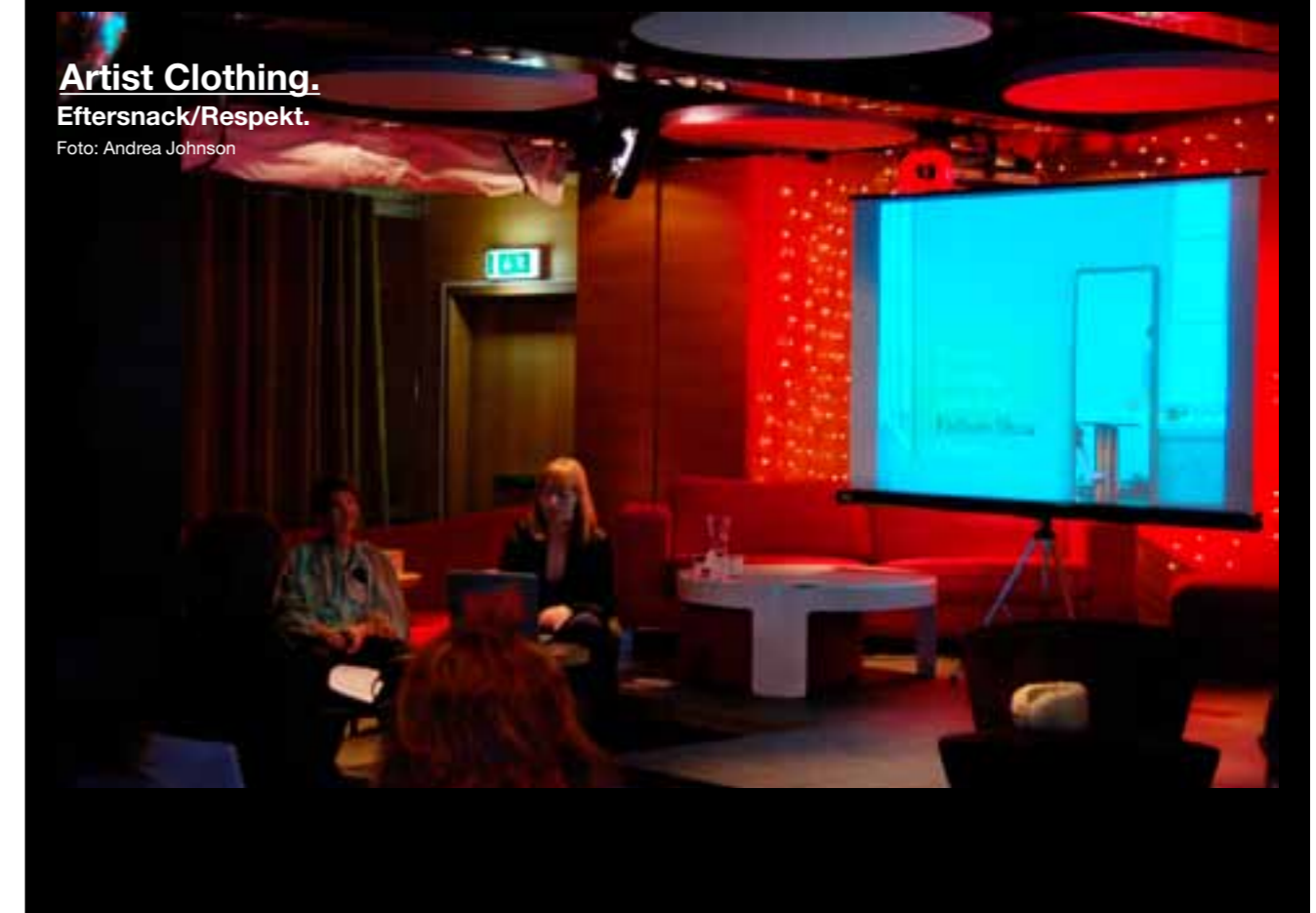
Artist Clothing. Eftersnack/Respekt.