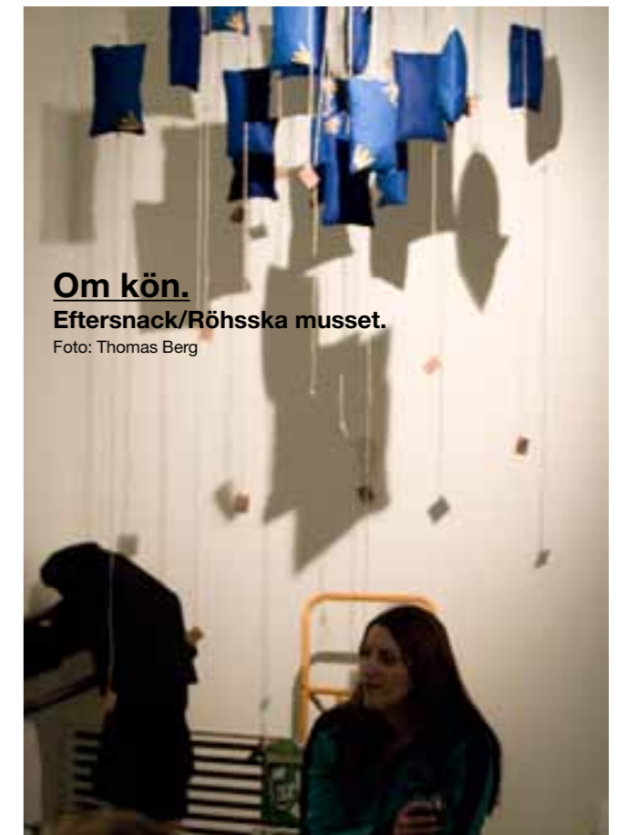
Om kön. Eftersnack/Röhsska museet.